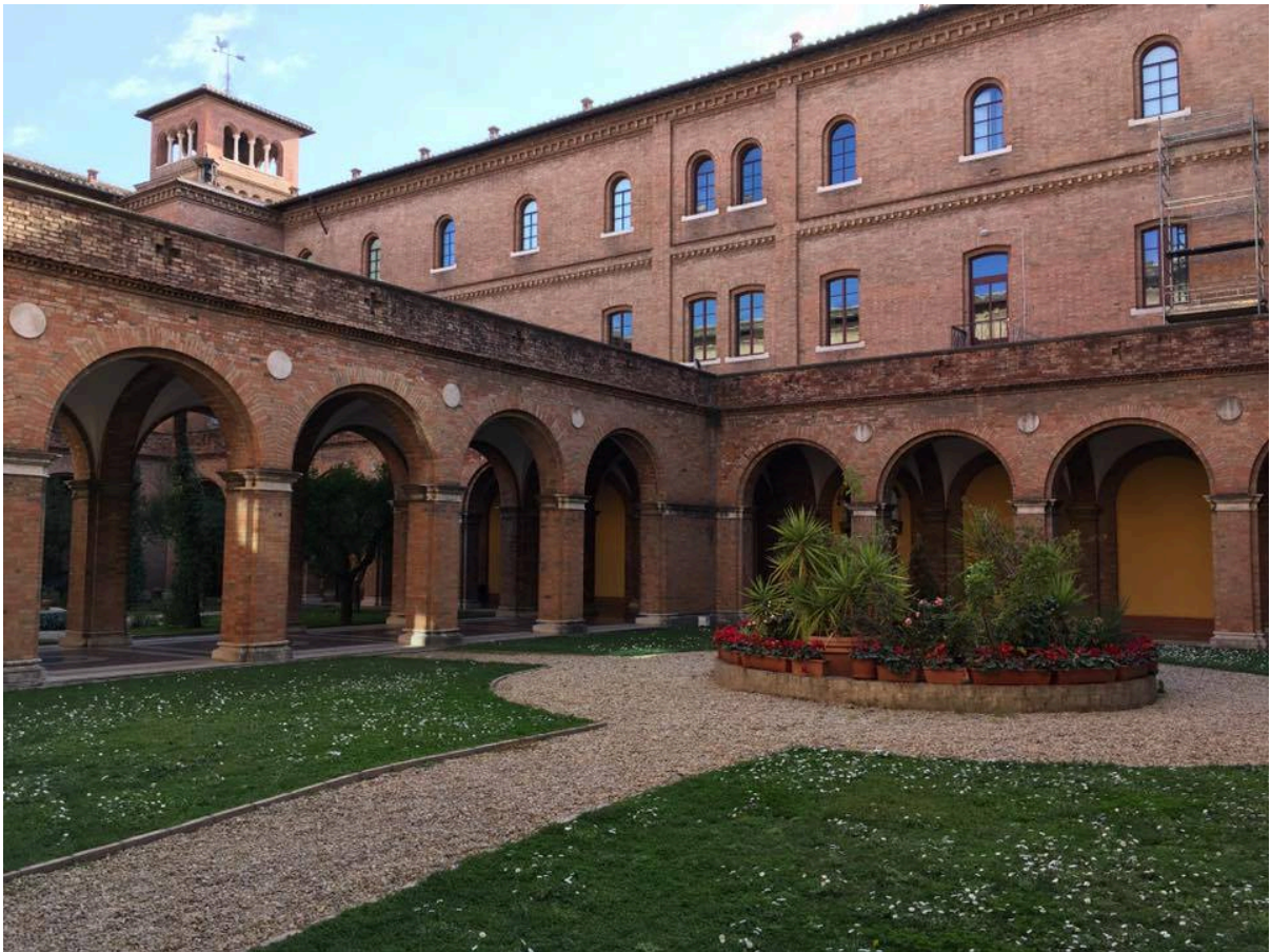
羅馬聖安瑟莫大學的中庭