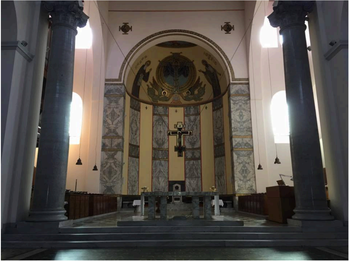
羅馬聖安瑟莫大學的大聖堂