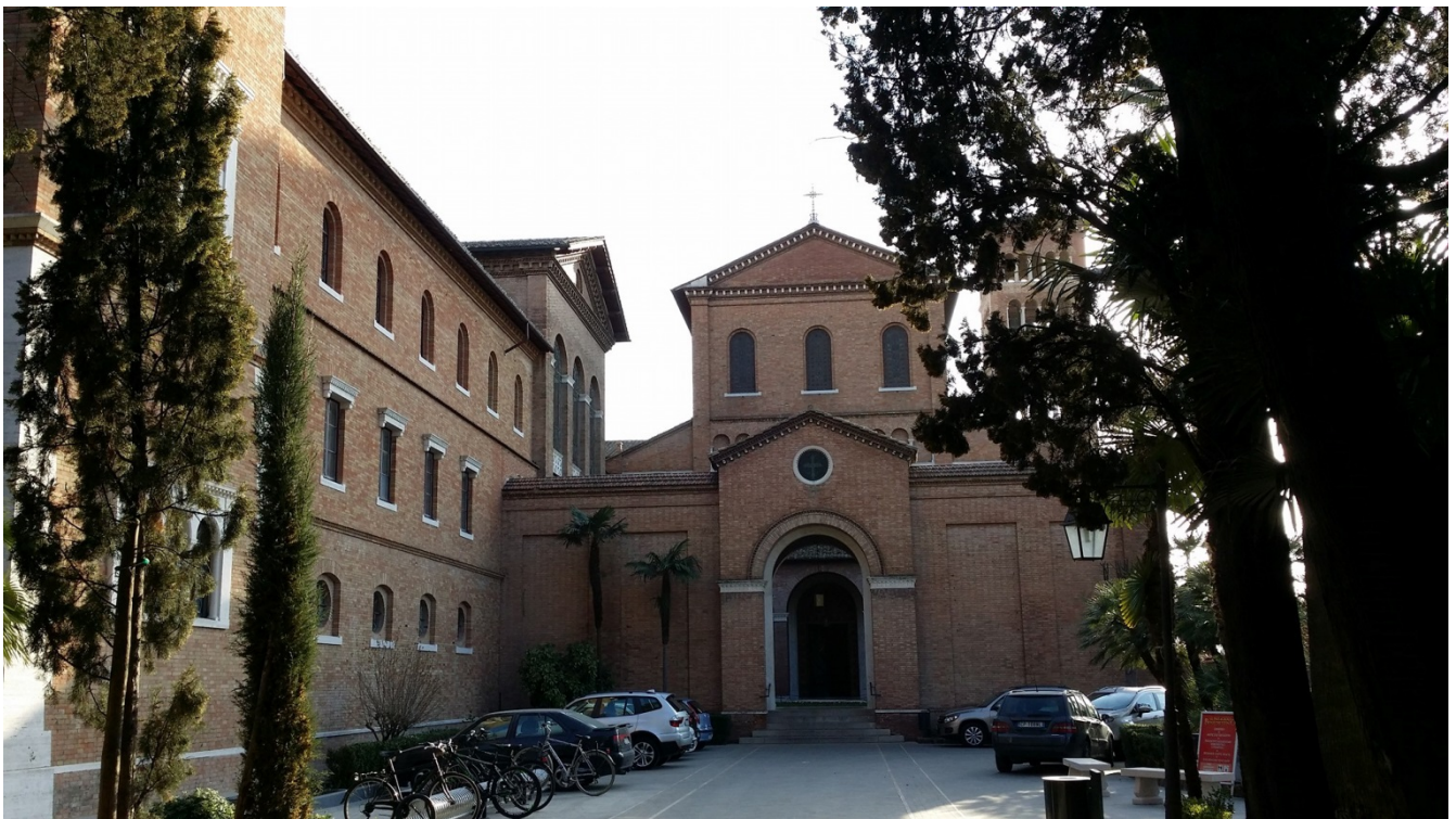
羅馬聖安瑟莫大學