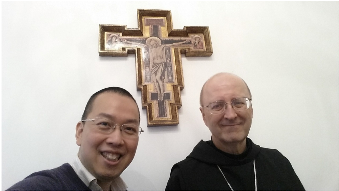
與聖本篤大院長 ABBOT GREGORY POLAN 合照