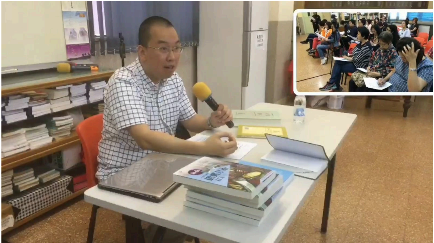
PHOTO11-12 是香港聖雲先義工隊---聖言誦讀之天主經講座