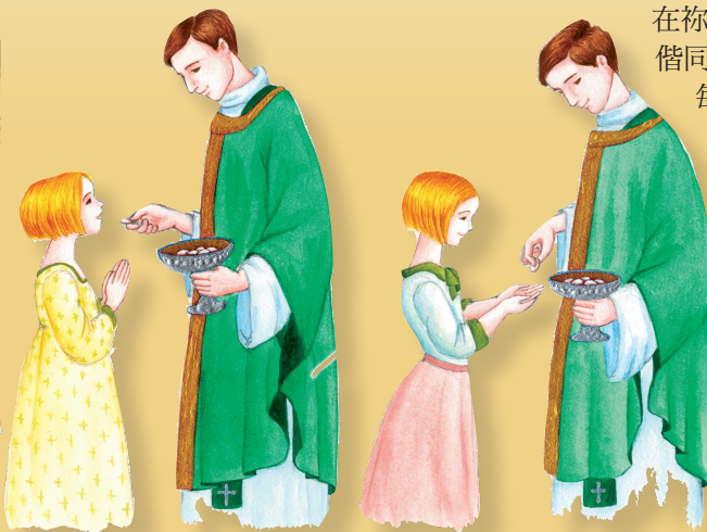
▲擘開祝聖後的麵餅並不是擘開耶穌的身體，耶穌完整地臨在每一片祝聖後的麵餅。 ▶可以直接口領聖體，或是以手接領聖體。